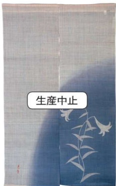
11-270-12 百合の花 藍 ¥ 31,000 (W900・H1,500) 麻100%