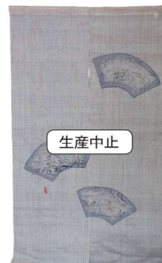
11-270-14 水旅び 手描き 紺 ¥ 35,700 (W900・H1,500) 麻100%