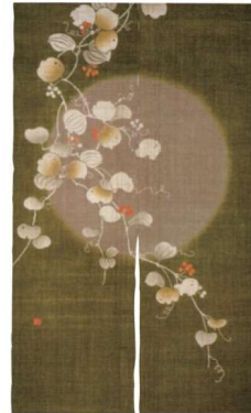
11-270-10 『さるとりいばら』 ¥ 43,500 (W880・H1,500) 麻100%