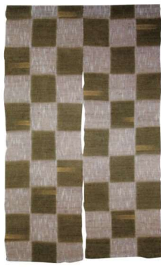
11-270-2 のれん『金彩市松 抹茶』 ¥ 32,500 (W850・H1,500) 麻100%