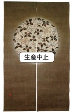
11-270-4 のれん『千両万両』 ¥ 39,500 (W880・H1,500) 麻100%