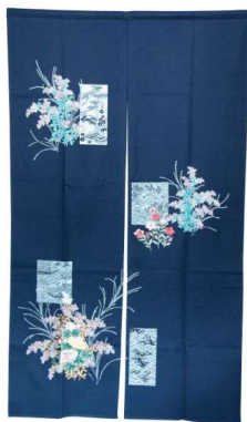
11-270-6 花柄 刺繍 ¥ 10,950 (W850・H1,500) 綿100%