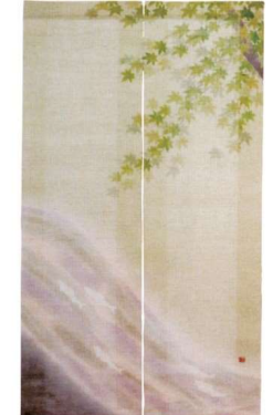
11-270-11 すかしのれん『楓に鮎』 ¥ 43,500 (W880・H1,500) 麻100%