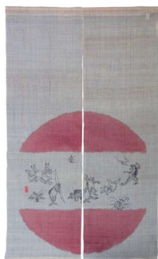
11-270-13 寿 手描き ローズ ¥ 35,700 (W900・H1,500) 麻100%