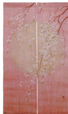
11-270-7 のれん『サクラノトキ』 ¥ 39,500 (W880・H1,500) 麻100%