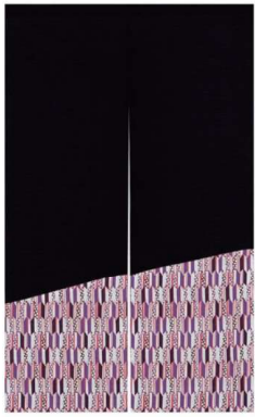
11-270-1 京矢絰ハッチワーク(紫) ¥ 11,900 (W900・H1,500) 綿100%