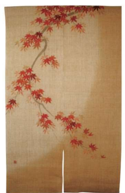
11-270-8 のれん『もみじ』 ¥ 43,500 (W880・H1,500) 麻100%