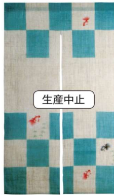
11-270-3 のれん『市松金魚』 ¥ 39,500 (W880・H1,500) 麻100%