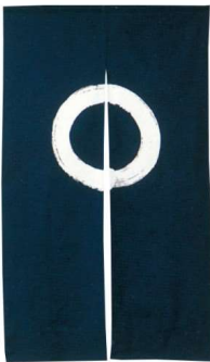
11-270-9 一筆丸 コンエンジ ¥ 13,100 (W900・H1,200) 綿100%