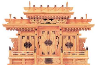
11-293-9 マス組付屋根違い三社(本けやき) ¥ 107,000 (W680・D250・H490)