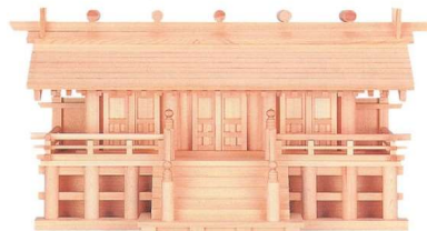
11-293-7 木曾通し三社(木曾ひのき)