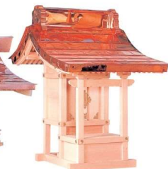
ほこら宮(木曾ひのき)