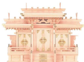
11-293-16 マス組付屋根違い三社・大(ひのき) ¥ 44,700 (W690・D270・H510)