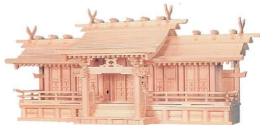
11-293-2 平安五社・中(木曾ひのき) ¥ 250,000 (W1,150・D330・H490)