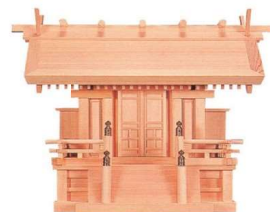
11-293-8 天神唐戸一社(木曾ひのき)