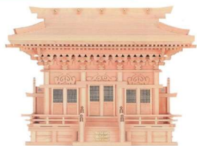
11-293-1 高殿(木曾ひのき) ¥ 302,000 (W780・D280・H600)