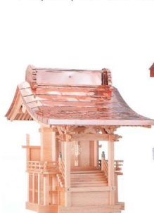
八幡宮(木曾ひのき)