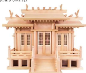
屋根違い三社(ひのき)