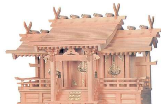
11-293-3 御嶽 特大三社(木曾ひのき) ¥ 129,000 (W760・D330・H490)