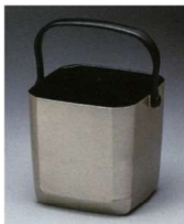
11-318-19 角アイスベール シルバーメタ ¥3,500 (W163・D163・H163)