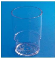
11-318-1 レギュラーカップ#94 ¥220 (φ68・H94) 入数: 240/ct・12ヶ箱入 容量: 250ml 材質: スチロール樹脂