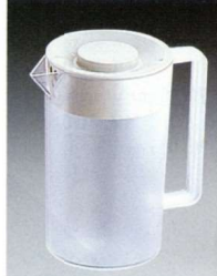
11-318-27 ジュニアピッチャー グレー ¥4,700 (φ130・H214)(2.2ℓ)