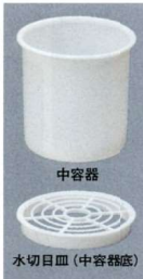
クールアイスベール 付属品