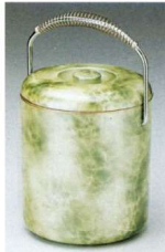
11-318-21 [A] クールアイスベール グリーン大理石 ¥2,800 (φ135・H155)