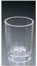
11-318-14 コーヒーカップ ¥800 (W74・H100) (210cc) 材質: アクリル