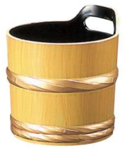
11-318-24 [M] 手桶型ワインクーラー 白木塗 ¥3,400 (φ160・H150)