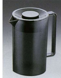
11-318-28 ジュニアピッチャー ブラック ¥4,700 (φ130・H214)(2.2ℓ)