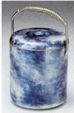
11-318-22 [A] クールアイスベール ブルー大理石 ¥2,800 (φ135・H155)