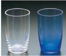
11-318-9 8オンスタンブラー ¥390 (W63・H98) (210cc)透明・ブルー 材質: アクリル