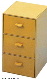
11-318-6 縦型ティーバック入 クリーム乾漆 ¥6,100 (W980・D990・H1,820)