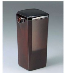
11-318-29 [A] 角ウォーターポット 溜 ¥3,300 (W108・D95・H215)