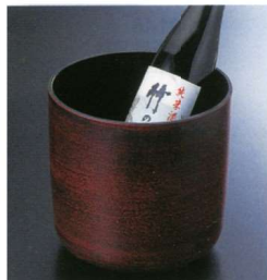
11-318-23 18cmワインクーラー 漆黒 ¥4,500 (φ180・H170)