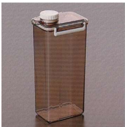
11-318-25 メロディーピッチャー1.8 ¥1,400 (W133・D102・H270) ●容量: 1.8ℓ ●材質: (本体・フタ)AS (止め具)ポリプロピレン (栓)ポリプロピレン (パッキン)シリコン