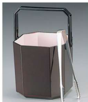
11-318-20 [A] スナック角アイスベール 溜(トング付) ¥2,500 (W132・D132・H136)