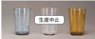
11-318-17 14オンスタンブラー ¥1,150 (W82・H121) (415ml) ブルー・クリア・セピア 材質: COP