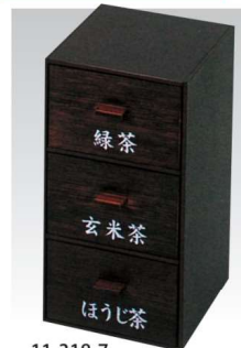
11-318-7 縦型ティーバック入 チーク ¥6,500 (W980・D990・H1,820) 名前は別料金