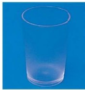
11-318-5 ユーゴンカップ ¥1,950 (φ61・H97) 入数: 50ダース/ct・12ヶ箱入 容量: 160ml 材質: スチロール樹脂