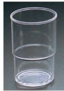
11-318-11 SKタンブラー ¥360 (W68・H100) (260cc) 材質: アクリル