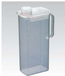
11-318-26 クールベル ¥1,700 (W170・D102・H270) ●入数: 36/ct・12ディスプレイボックス ●容量: 1.9ℓ ●材質: (本体・フタ)メタクリル樹脂 (止め具)ポリプロピレン (栓)ポリプロピレン (パッキン)シリコン ●パッケージサイズ: W555・D460・H300