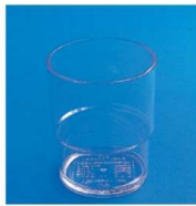
11-318-3 レギュラーカップ#82 ¥190 (φ68・H82) 入数: 240/ct・12ヶ箱入 容量: 210ml 材質: スチロール樹脂