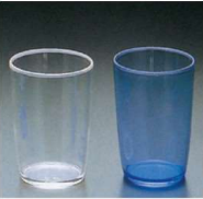
11-318-10 6オンスタンブラー ¥290 (W59・H84) (145cc)透明・ブルー 材質: アクリル