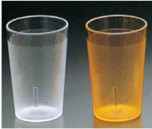
11-318-8 8オンスタンブラー(シボ付) ¥320 (W67・H101) (240cc)透明・オレンジ 材質: アクリル