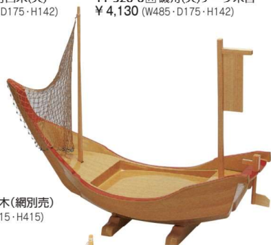
11-326-9 宴舟 白木(網別売) ¥ 35,500 (W818・D315・H415)