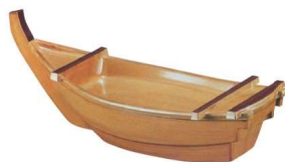
11-326-7 快慶盛舟 白木 ¥ 3,200 (W350・D127・H130)