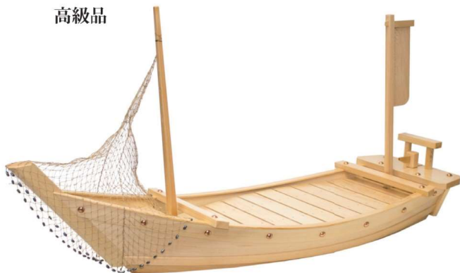
11-326-15 白木盛舟(小) ¥ 37,800 (W800・D280・H200) 11-326-16 白木盛舟(中) ¥ 41,300 (W930・D320・H260) 11-326-17 白木盛舟(大) ¥ 50,000 (W1,090・D360・H280)