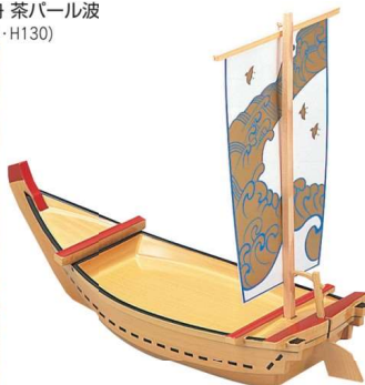
11-326-10 2尺宝舟白木塗 ¥ 15,600 (W625・D230・H560)