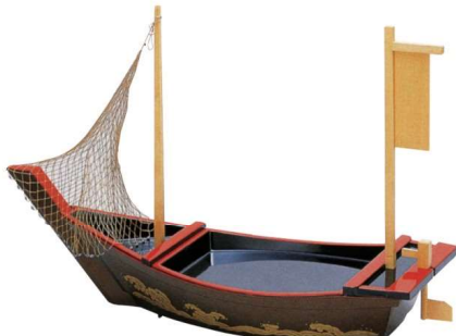
11-326-13 2尺7寸盛込舟 梨地波(網別売) ¥ 22,680 (W815・D284・H245)