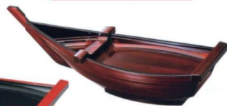
11-326-5 磯舟(小)チーク木目 ¥ 2,270 (W420・D153・H138) 11-326-6 磯舟(大)チーク木目 ¥ 4,130 (W485・D175・H142)