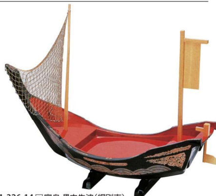
11-326-14 宴舟 黒内朱波(網別売) ¥ 36,800 (W818・D3'5・H415)