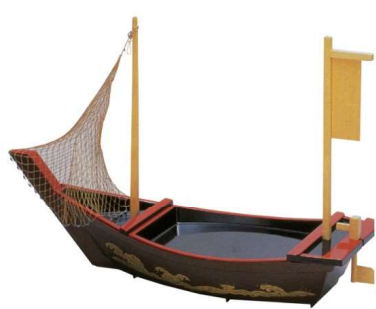
11-326-12 2尺3寸盛込舟 梨地波(網別売) ¥ 18,400 (W680・D238・H210)