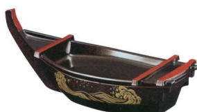
11-326-8 快慶盛舟 茶パール波 ¥ 3,100 (W350・D127・H130)