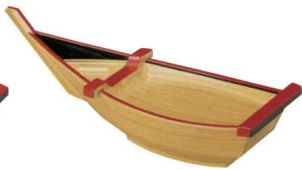
11-326-2 一人用宝舟 白木 本体 スノ子 ¥ 2,350 (W420・D153・H145)