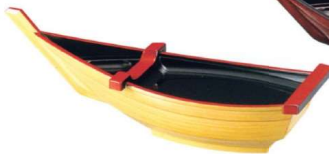
11-326-3 磯舟白木(小) ¥ 2,360 (W420・D153・H138) 11-326-4 磯舟白木(大) ¥ 4,290 (W485・D175・H142)