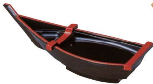
11-326-1 一人用宝舟 本体 茶パール天朱 スノ子 黒天朱 ¥ 2,270 (W420・D153・H145)