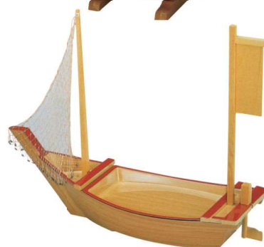
11-326-11 2尺3寸盛込舟 白木(網別売) ¥ 22,000 (W680・D238・H210)