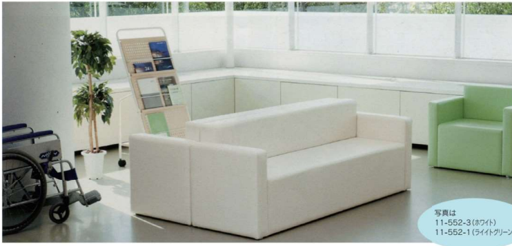
写真は 11-552-3(ホワイト) 11-552-1(ライトグリーン)