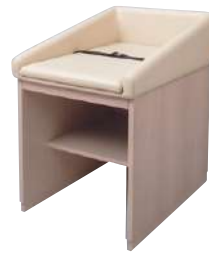
◆ S-BK-101A-NW オムツ子NW® ¥ 145,000 W620・D850・H930 主材: ウレタンフォーム・木合板 MDF(中密度繊維版)・メラミン化粧板 張材: ビニールレザー ※安全ベルトバックルマグネット仕様