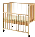
扉は一番下まで降ろしても床板との間にすき間があり、指をはさむ心配がありません。また、特殊な金具を使用していますので、フレームから外れる心配もありません。