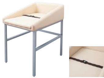
◆ S-BK-102-NS2 オムツ子NS2® ¥ 130,000 W620・D850・H910 主材: スチール・粉体塗装(シルバー) ウレタンフォーム・合板 張材: ビニールレザー ※安全ベルトバックルマグネット仕様