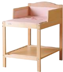
★ S-BK-301 オムツ替え台 ¥ 73,400 W650・D840・H975 主材: ビーチ材 張材: 抗菌レザー (安全ベルト付)