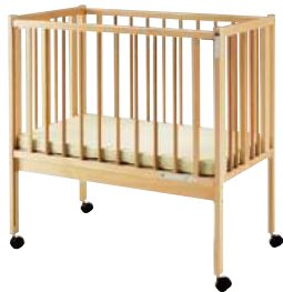
■ S-BK-330 ¥ 168,000 W1,050・D655・H1,100 主材: ビーチ材・ウレタン塗装 扉スライド式・キャスター付 ウレタンマット付: W1,000・D600・t50