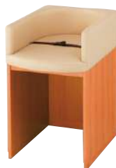
◆ S-BK-200-NR オムツ替え台 ¥ 120,000 W550・D800・H930・MH730 主材: メラミン化粧板 張材: 防汚ビニールレザー ※安全ベルトバックル3本爪仕様