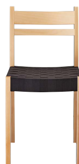
プラッドイスNA3 11916-A ¥36,800