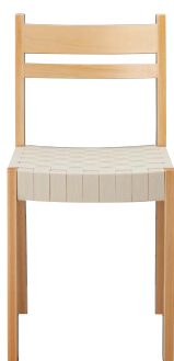
プラッドイスNA1 11914-A ¥36,800