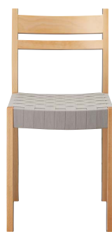
プラッドイスNA2 11915-A ¥36,800