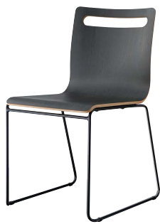
サーフィスB-BL2 21806-A 合板シート ¥39,800