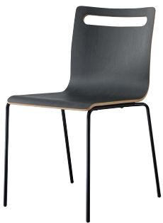
サーフィスA-BL2 21804-A 合板シート ¥38,800