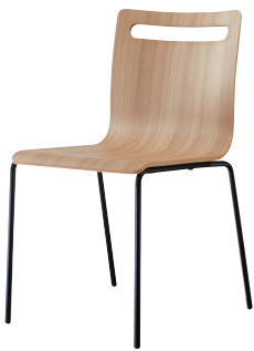
サーフィスA-BL1 21803-A 合板シート ¥38,800

時代に沿ったカラーコーディネート。 スタイリッシュな空間におすすめしたい一脚です。