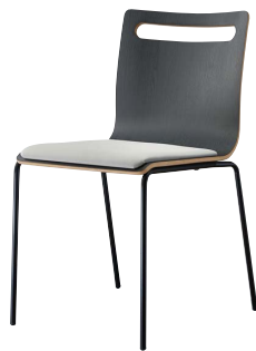
サーフィスC-BL2 21808-A C/レザー・ゼラファイト・プロL-8092