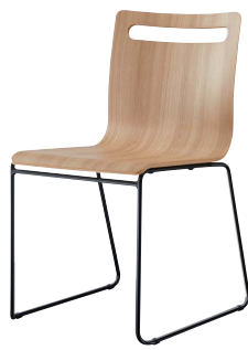
サーフィスB-BL1 21805-A 合板シート ¥39,800