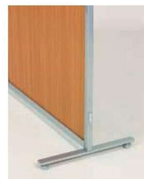
SMP-F SMP安定脚(アジャスター脚)