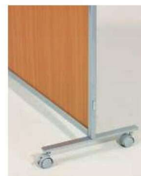
SMP-FK SMP安定脚(キャスター脚)

仕様/枠:スチール 粉体塗装(シルバー) パネル:AR/アクリル樹脂(t3.0mm) 入数:1